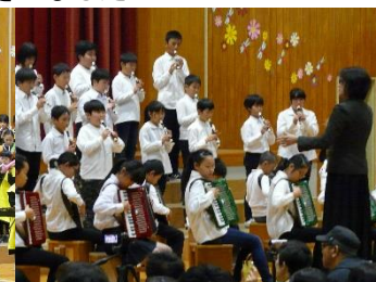
5年史宇宙戦艦ヤマト！