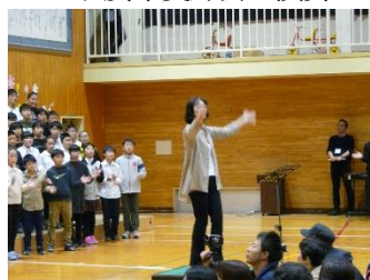
全校合唱 パブリカ