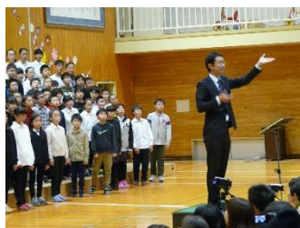
全校合唱 新八戸市民の歌