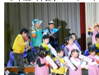
2年劇 しばらくの関