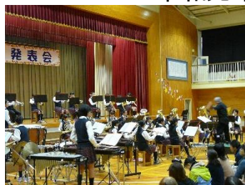
吹奏楽愛好会の演奏