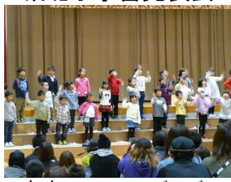
1年生ワンニャーブー...