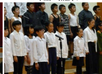
心に残る6年劇はだしのゲン