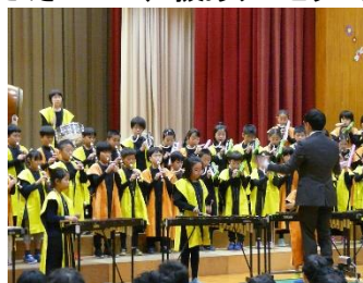
3年生八木節、ソーラン！