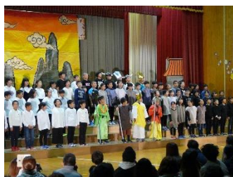
4年劇西遊記八戒と肉まん